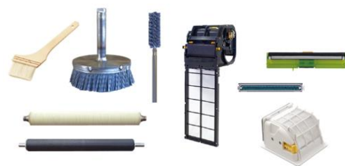
コーワのブラシ製品

また、2019年には「tanQest（タンクエスト）」という自社ブランドを立ち上げ、これまで培ったブラシのクリーン技術を活かした自社商品の開発にも取り組んでいます。tanQestは探究/tanQ=quest+est(最上級形)の造語で、デザイン・パフォーマンス・クオリティすべてにおいて最上を目指すことを意味しています。